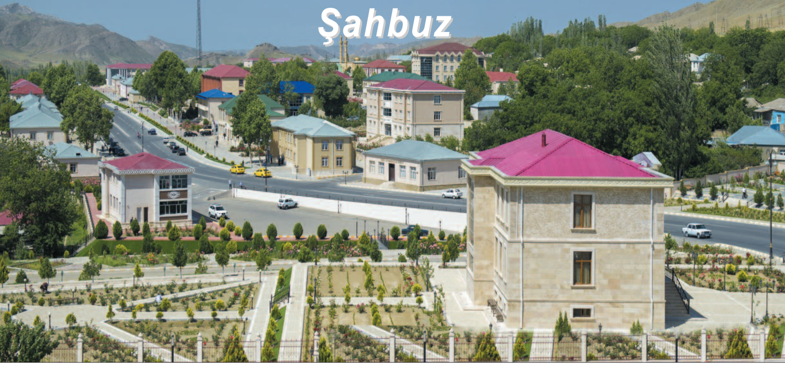
Dünən yaşanımlar, bu gün yaşananlar

B u yay günlərində zirvəsindən qarı qurtarmayan dağların yamaclarına və ətəklərinə elə bil xalı səriblər Şahbuzun. Minbir dərindən dərmanı olan gül-çiçəkləri bu xalının naxışlarıdır. “Ulu Tanrı bu qədim yurd yerindən öz səxavətini əsirgəməyib” qənaətində olanlar düz düşünürlər. Bilmirsiniz, Şahbuzun hansı gözəlliyinin vəsfündən başlayasan. Əslində buna heç jurnalist qələminin gücü də çatmaz. Şair istəyir seir qoşa, rəssam lazımdır tabloya köçürə, bəstəkar yolunu gözləyir ki, nəğmə bəstələyə belə gözəlliklərə.